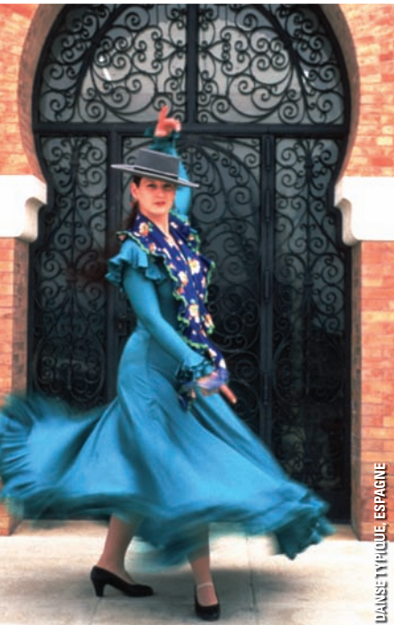
DANSE TYPIQUE ESPAGNE