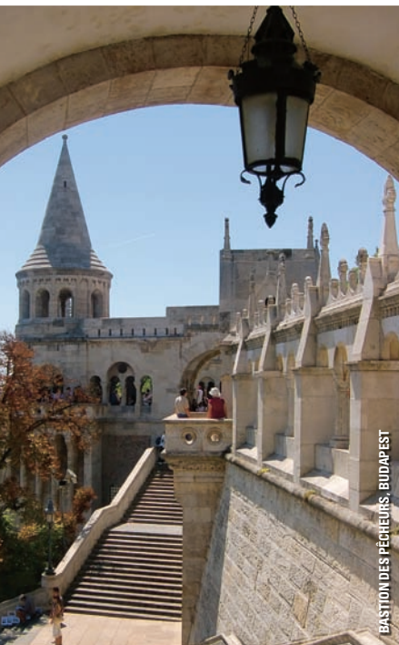
BASTION DES PÊCHEURS, BUDAPEST