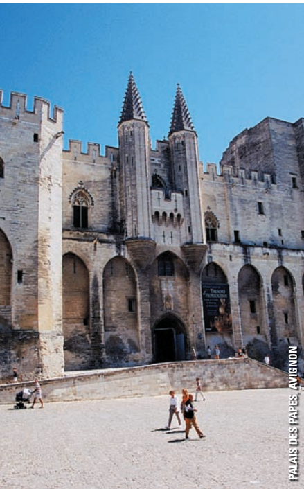
PALAIS DES PAPES, AVIGNON