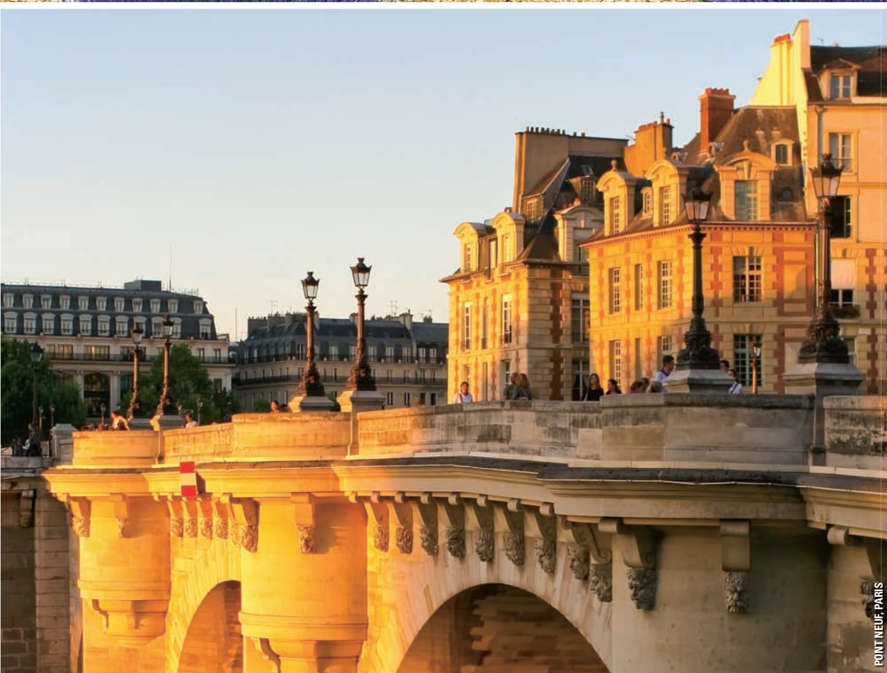
POINT NEUF, PARIS