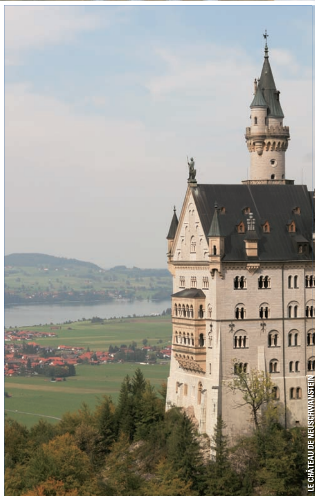
LE CHÂTEAU DE NEUSCHWANSTEIN