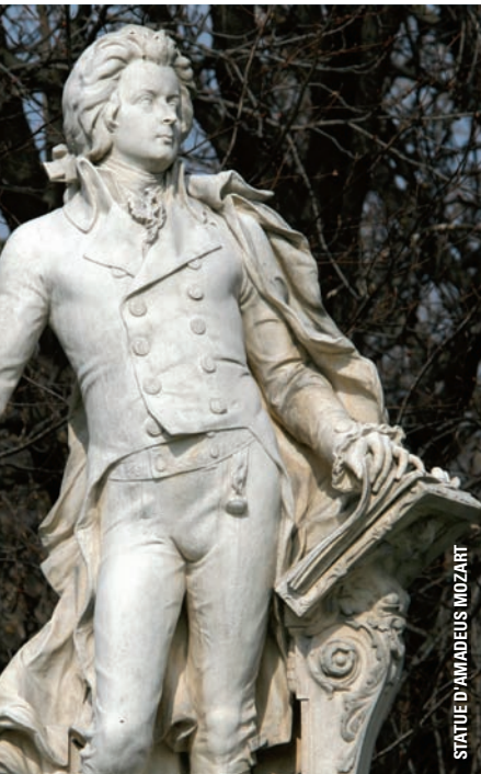
STATUE D'AMADEUS MOZART