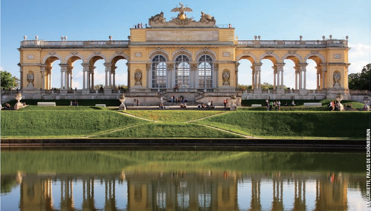
LA GLORINETTE, PALAIS DE SCHÖNBRUNN