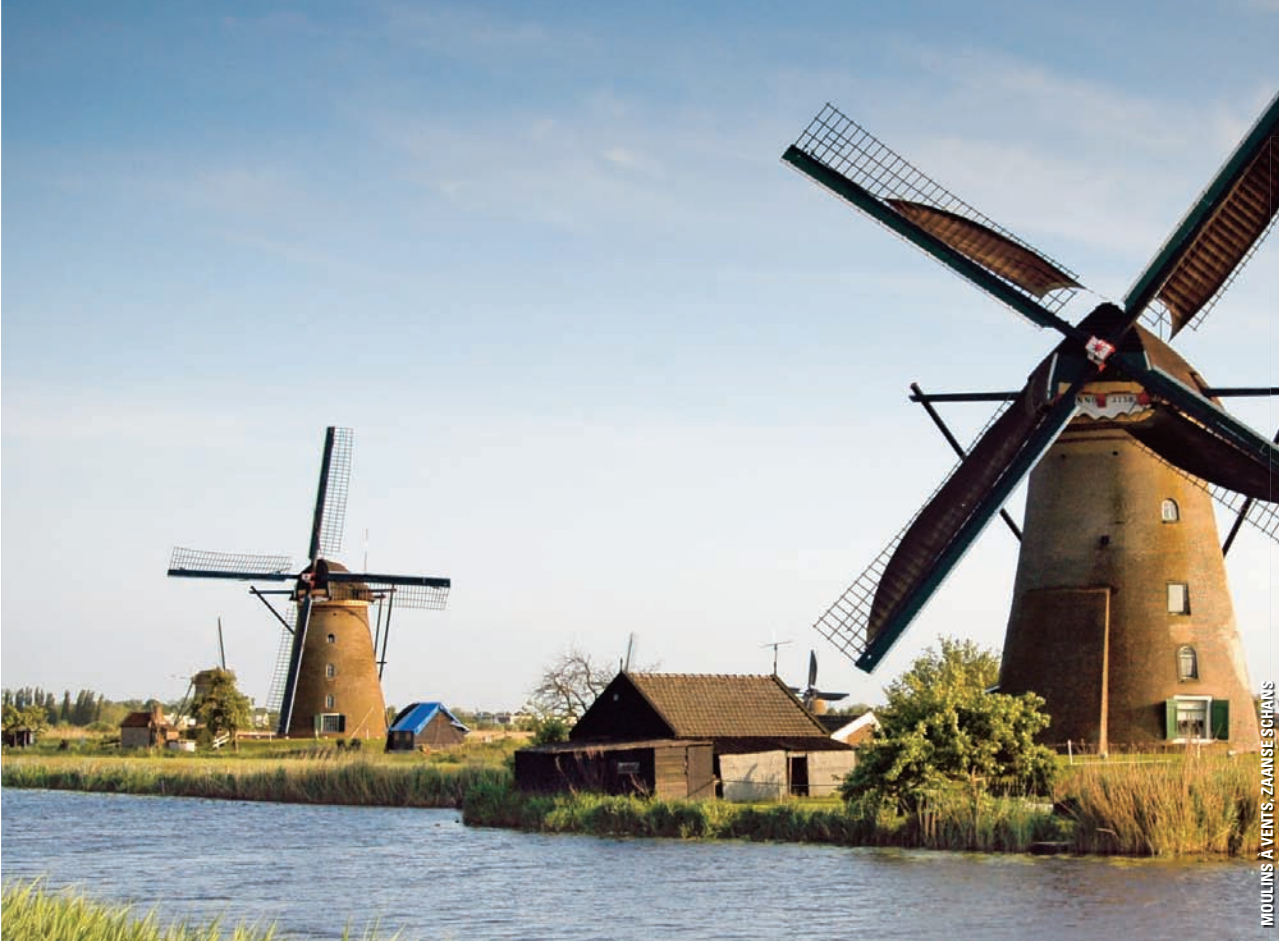
MOULINS À VENTS, ZANSE SCHANS