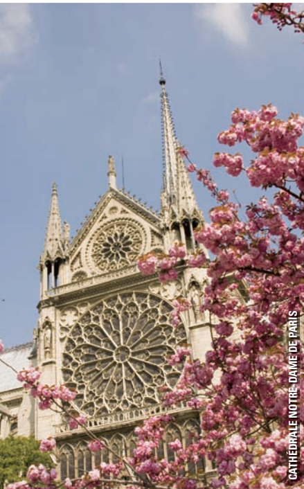
CATHÉDRALE NOTRE-DAME DE PARIS