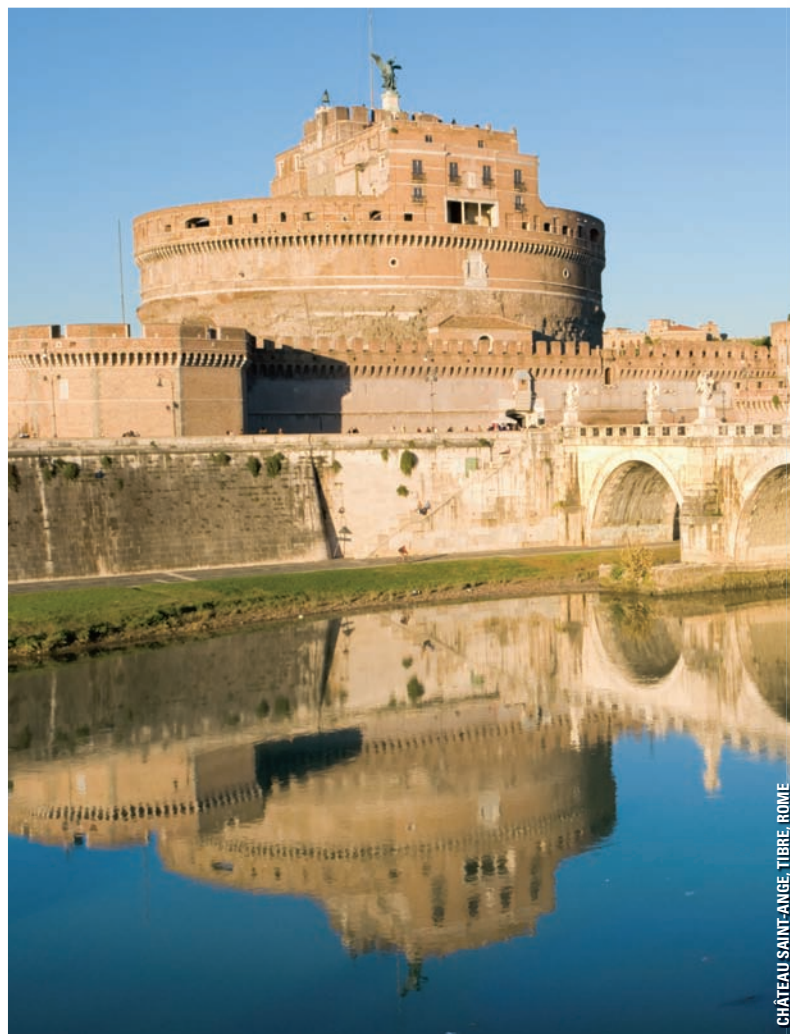
CHÂTEAU SAINT-ANGE, TIBRE, ROME

Transfert à l'aéroport et vol de retour à Montréal. (DB)