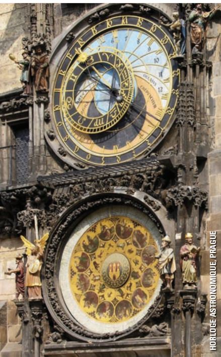
HORLOGE ASTRONOMIQUE, PRAGUE