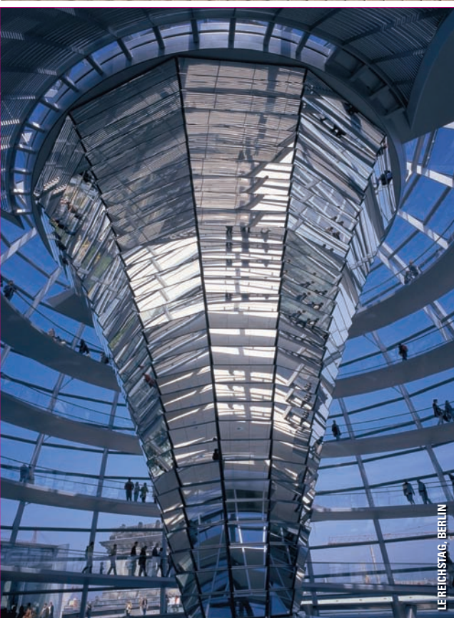
LE REICHSTAG, BERLIN