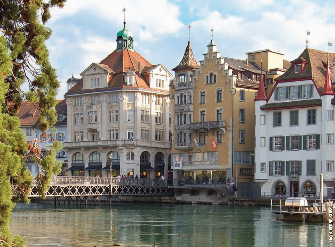
LAC LUCERNE, SUISSE