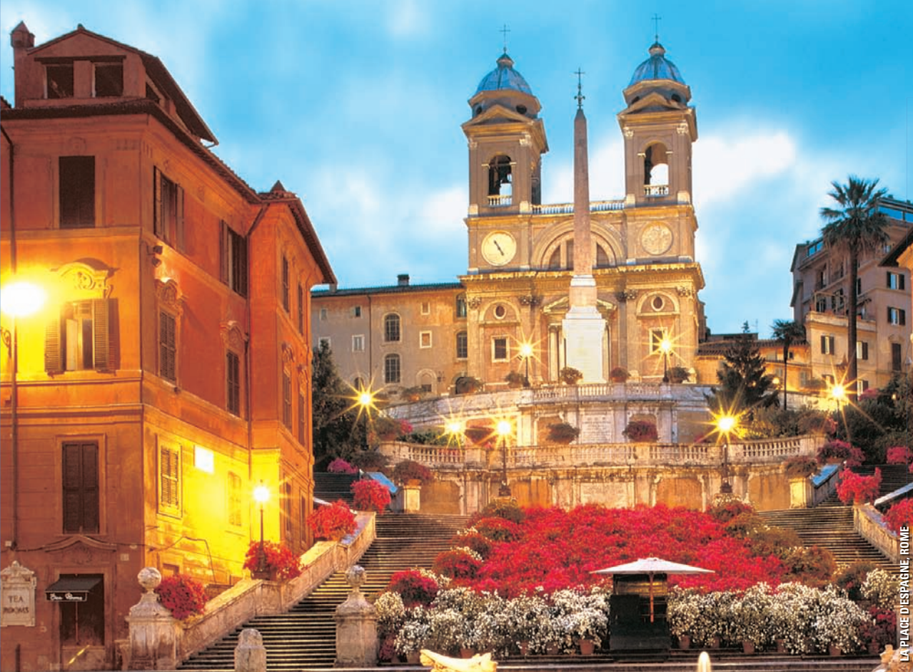
LA PIAZZE D'ESPAGNE, ROME