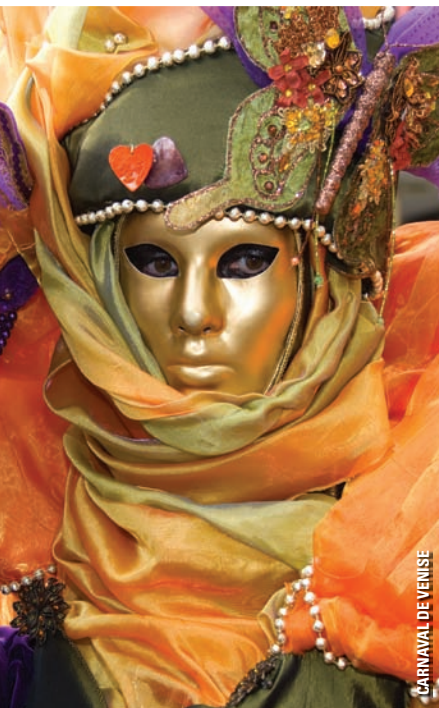
CARNAVAL DE VENISE