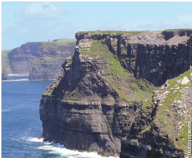
FALAISES DE MOHER

du Millénaire vous verrez aussi le château historique de Cardiff datant du XI e siècle que décora de façon exotique le 3 e marquis de Bute, que l'on tenait en 1900 pour l'homme le plus riche d'Angleterre. Par la suite, vous traverserez le pont Severn avant d'arriver à Bath. Vous aurez la chance de marcher dans les rues de cette cité splendide, véritable joyau de l'architecture géorgienne, et de voir le monumental Royal Crescent, emblème de la ville. Puis, vous contournerez la mystérieuse Stonehenge et ferez une halte à Salisbury pour aller voir la cathédrale et sa célèbre flèche avant de retourner à Londres. En soirée, souper d'au revoir avec le groupe (incluant un verre de vin ou de bière). (DA) (S) (310 km)