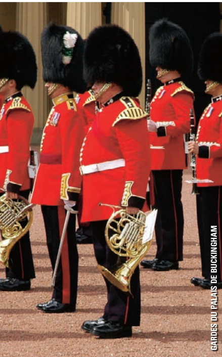
GARDIENS DU PALAIS DE BUCKINGHAM